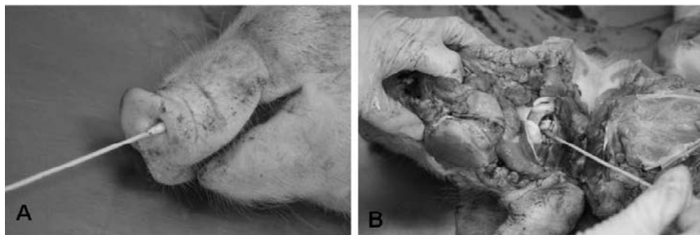
Figure 1. Collection of samples for the bacteriological examination.

Figura 1. Impiego del tampone nell'esecuzione di prelievi per l'esame batteriologico.